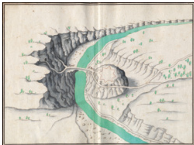
Gravure du Pont d'Arc, s.d., 1 | 198.

D'autres actualités sont à (re)lire sur le site. Puissent-elles vous enchanter et vous faire patienter jusqu'à la réouverture des Archives à Privas ! ■