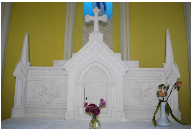
Retable et tabernacle de la chapelle photo prise par