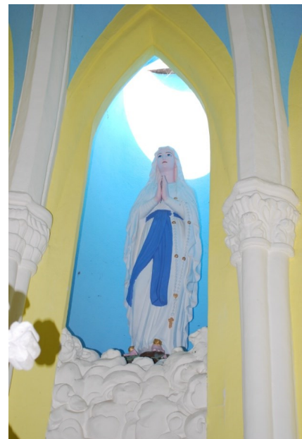
la vierge du chœur photo prise par SRG en juin 2012