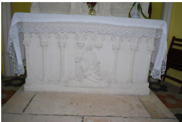
L'autel de la chapelle

La chapelle abrite un autel dont la table représente une Pietà.