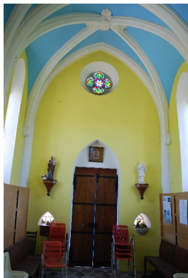
L'intérieur de la chapelle photo prise par SRG en juin 2012 : côté autel et côté entrée