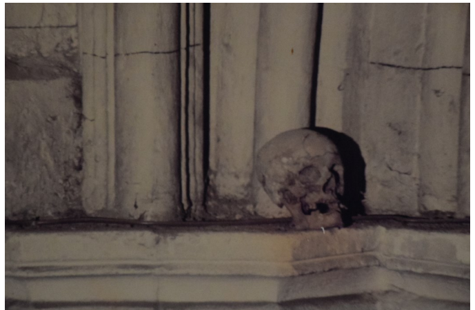
photo prise d'une photo sur un panneau dans l'église de Largentière par SRG en juillet 2022