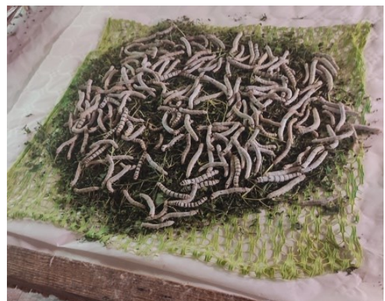
De nos jours, filet de plastique...

Le délitement – La litière doit être parfaitement propre, sèche et peu abondante. Pour nettoyer l'espace de vie des vers à soie, il faut déliter complètement, c'est-à-dire ôter, détacher les vers à soie de leur litière, mais sans les manipuler. Les filets de fil ou de papier sont à nouveau utilisés : on attend que tous les vers soient montés sur les feuilles fraîches par les trous, ascension qui s'opère ordinairement en une demi-heure. Les filets sont ensuite enlevés et placés avec feuilles et vers sur une claie inoccupée. Papiers et anciens filets souillés sont ensuite roulés avec les excréments, les mues et les débris végétaux puis débarrassés hors de la magnanerie, sans soulever de poussière par souci d'hygiène afin d'éviter toute source de maladie.