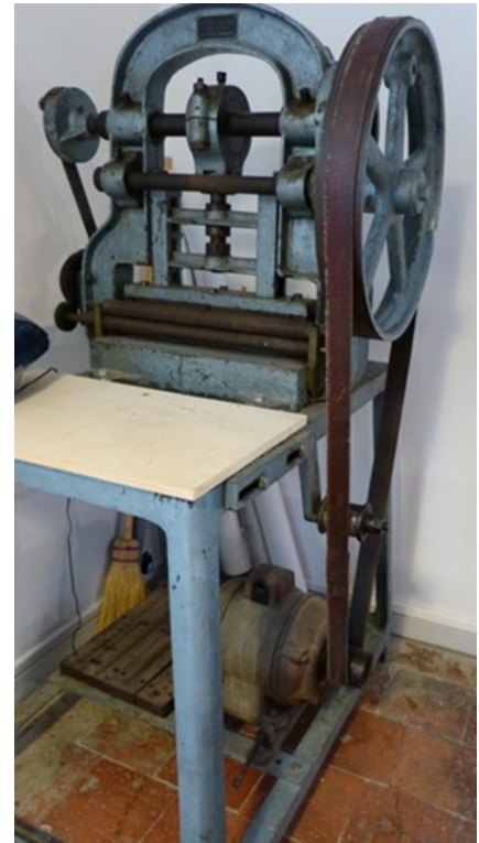
Perforatrice électro-mécanique Italie 1950/1975

Les découpeurs à l'emporte-pièce, qui sont employés à ce travail, se servent d'ordinaire d'un poinçon mécanique; dans les petites maisons, on use d'un poinçon à main. L'ouvrier dispose, les unes sous les autres, une trentaine de feuilles de papier, et chaque pesée de l'outil fait tomber une pile de confetti. Un sac, disposé à cet effet, les reçoit; on les remue aussitôt avec un pilon à main, afin qu'ils ne se collent pas ensemble.