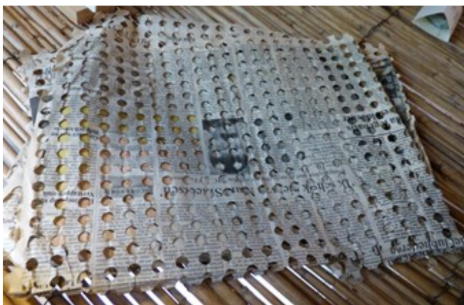
Filet de papier

Musée de la soie – St Hippolyte du Fort (30)