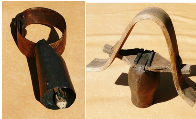
Une clappe et un redon ardéchois, la première pour une chèvre, le deuxième pour un béliet

On distingue plusieurs tailles de clochettes, toutes avec un nom distinctif : clappes, clavelas, picons ; glochard ou redon pour les plus grosses. Les battants sont faits en pierre, si possibles en silex. Les taillandiers qui forgent les cloches doivent donc veiller à avoir des cloches différenciées ou au contraire des séries toutes semblables.