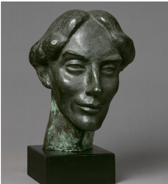
Sculpture de Roger Fry . Bronze. 1920