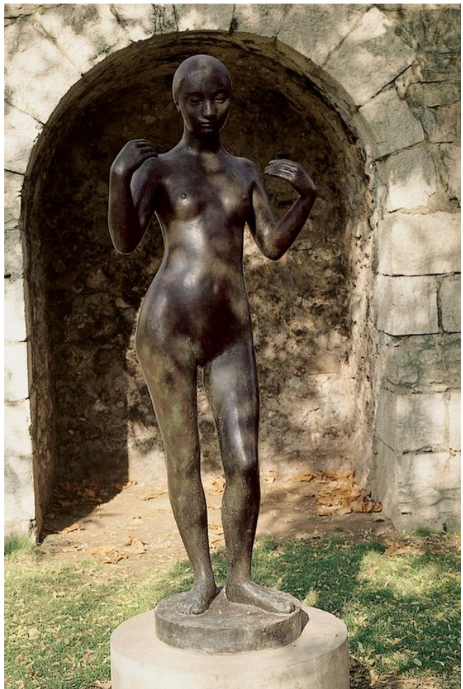
Bronze de la jeune fille debout