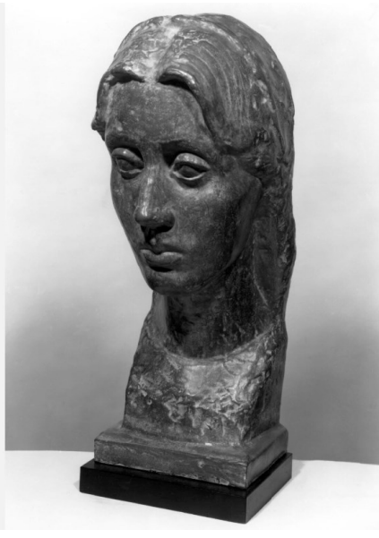
Sculpture de Vanessa Bell