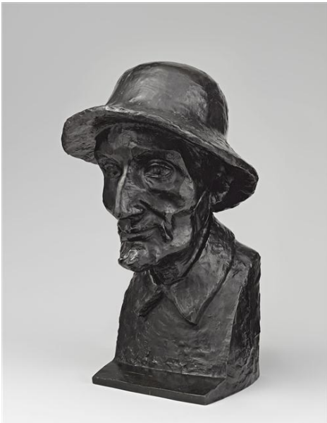
Buste de Renoir. Bronze.

Il sculpte des murs et de très nombreux bustes. Il est connu pour sa stylisation dépouillée dans ses œuvres.