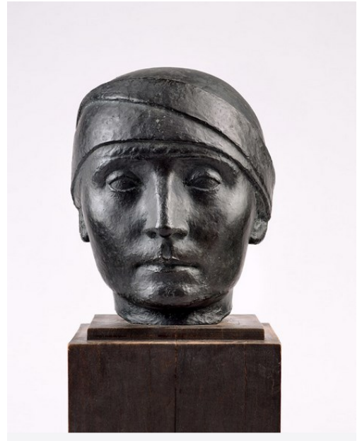
Tête de femme au turban. Bronze.